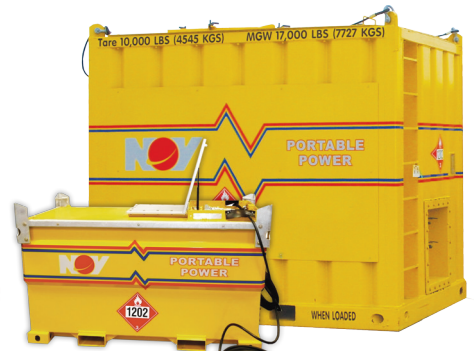
528 gal至2,350 gal 双层油箱