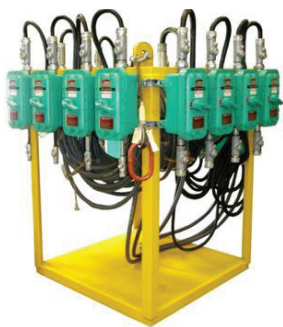
防爆、防雨型 配电机架