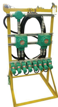
防爆、防雨型 插座机架