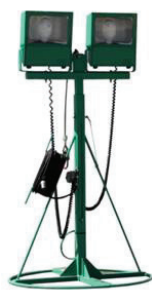
防爆、防雨型 照明装置