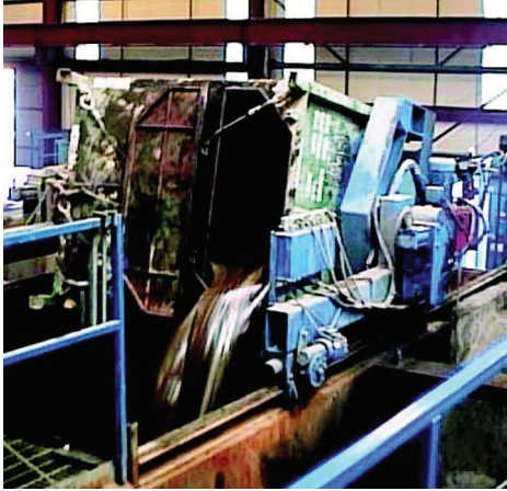
Cuttings Skips Turner

كان الوعي المتزايد بأمن السلامة في التعامل مع الرافعات هو الإلهام وراء تصميم Cuttings Skips Turner وتصنيعه بهدف تصريف أسفاط الشدراوات وتنظيفها في البحر. يعمل Cuttings Skips Turner على تحسين مستوى السلامة كما يقلل من وقت المعالجة.