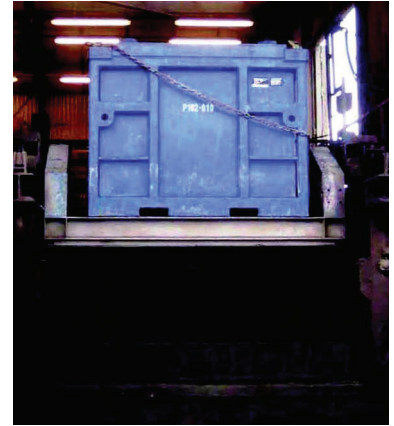
Cuttings Skip موضوع على طاولة دوّارة