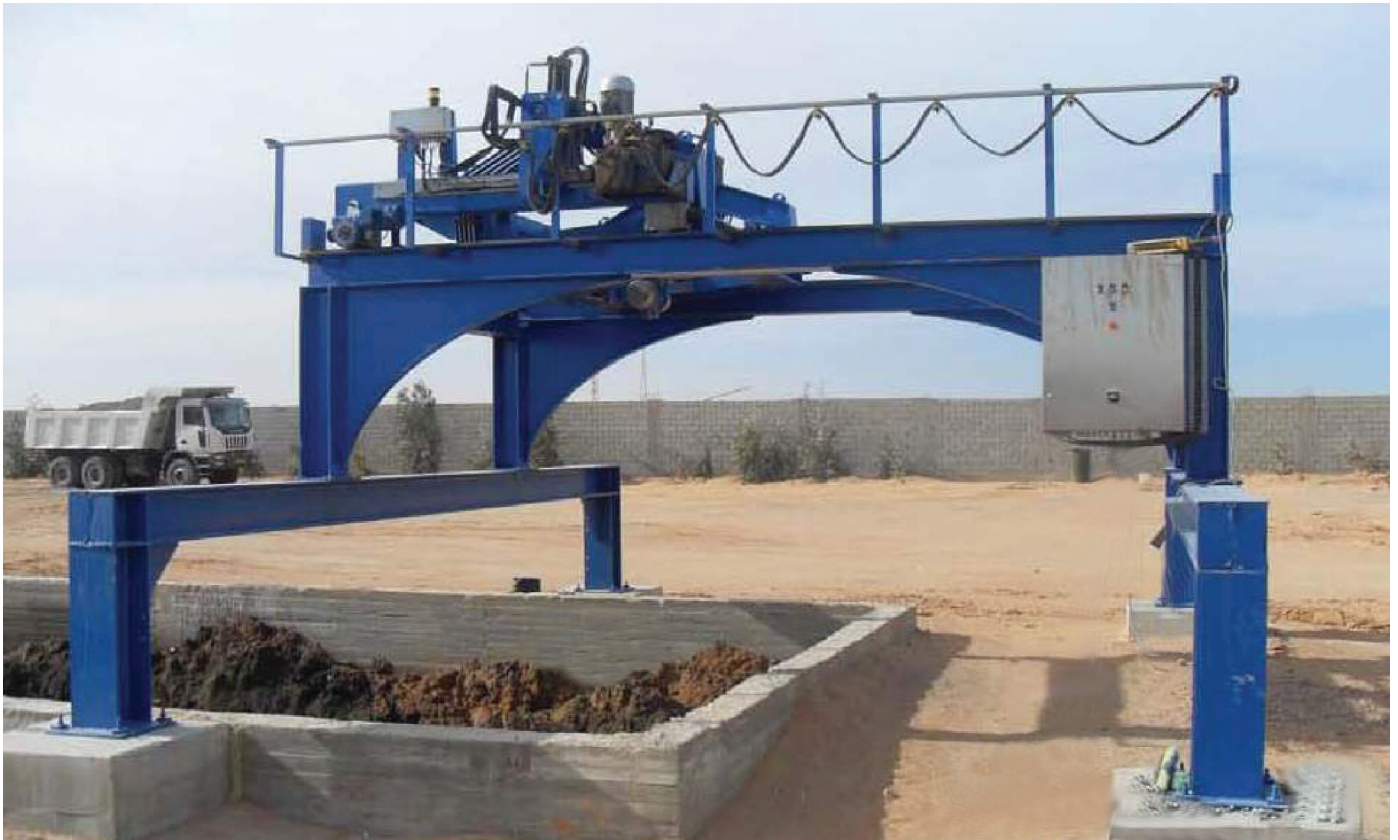
Skips Turner مثبت فوق حفرة "في الأرض"