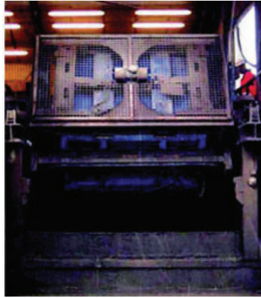
تدور الطاولة الدوّارة حتى تصل إلى وضع التصريف التام