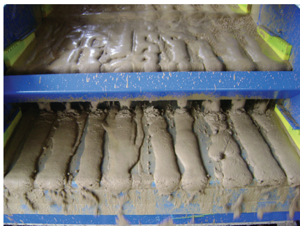
Améliore le transport des déblais