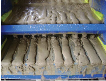
Mejora el transporte de los recortes