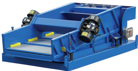
Peneira vibratória individual LCM-3D In-Line de 4 painéis