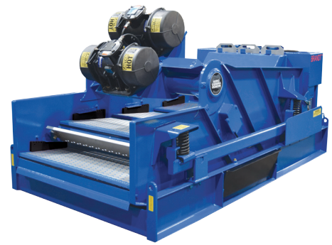
KING COBRA VENOM Peneira Vibratória com CONSTANT-G CONTROL

As peneiras VENOM eliminam a necessidade de borrachas nas coroas e proporcionam melhores transporte de sólidos e rendimento de fluido. É usado um sistema de cunha de peneira robusto e confiável para proteger as peneiras. Um ajuste do ângulo do deck de ponto único pneumático é um recurso padrão.